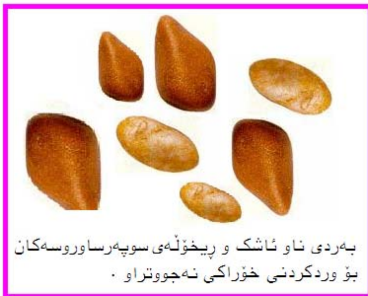
به‌ردی ناو ئاشک و رپخۆله‌ی سوپه‌رساوروسه‌کان بۆ وردکردنی خۆراکی نه‌جووتراو .

سوپه‌رساوروس کژ و گیا و لک و پۆپی دار و دره‌ختانی به په‌له و به‌بی جووتن قووت داوه و له رپخۆله دوور و دریژه‌کانی دا ده‌گه‌ل به‌ردی نیو ئاشک و رپخۆله‌کانی دا لیککی داون و وردی کردوون.