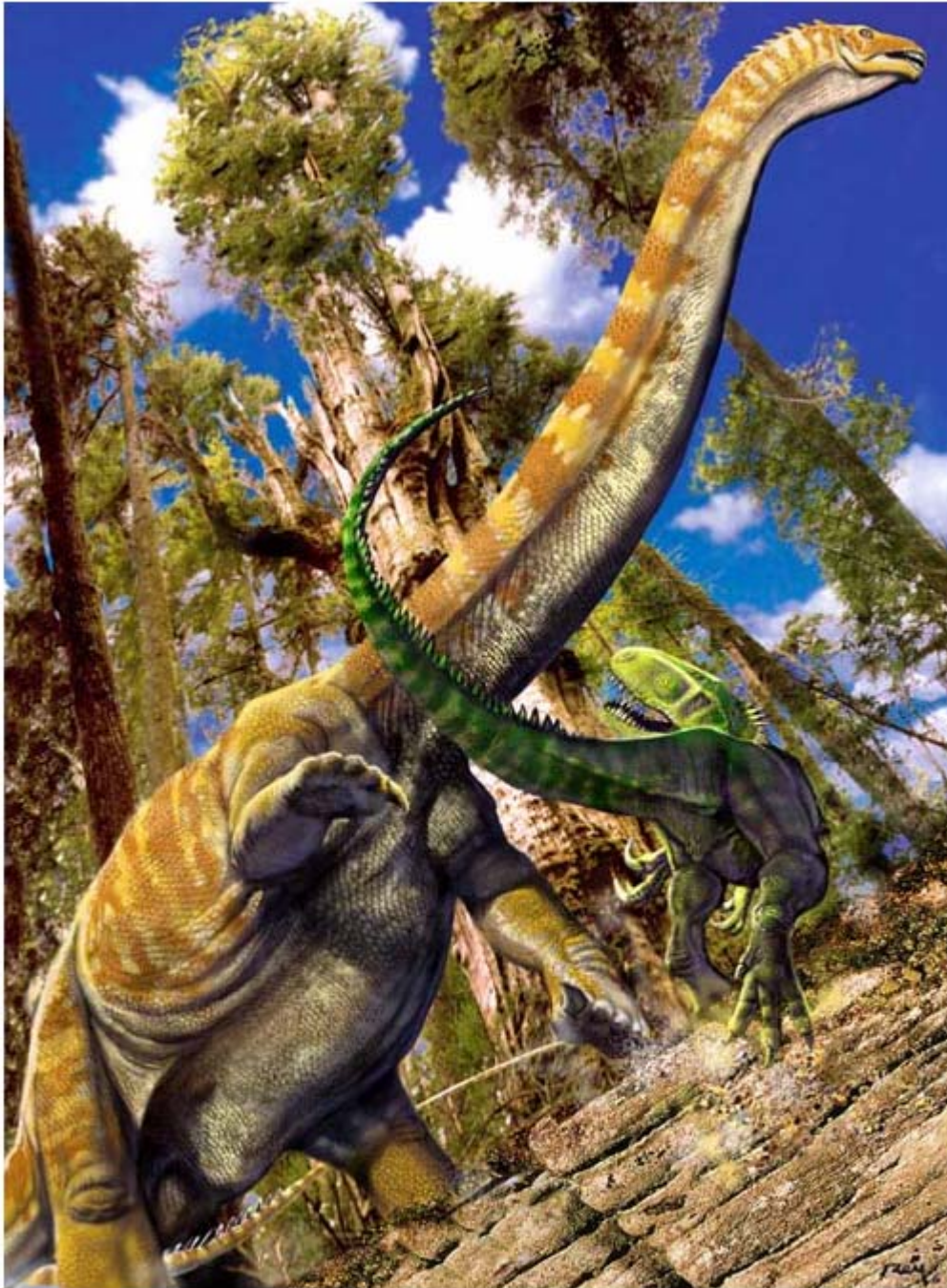
سوپهرساوروس لهوانهیه نینۆکی دهست و پپی له دژی هیرشکاران بهکار هینا بیټ .

زهوی و دهرهینانی رهگ و پیشهی دار و درهخت، یان بو شهړ و بهرگری له دژی گیاندارانی هیرشکار، کهلکی لی وهرگیراوه.