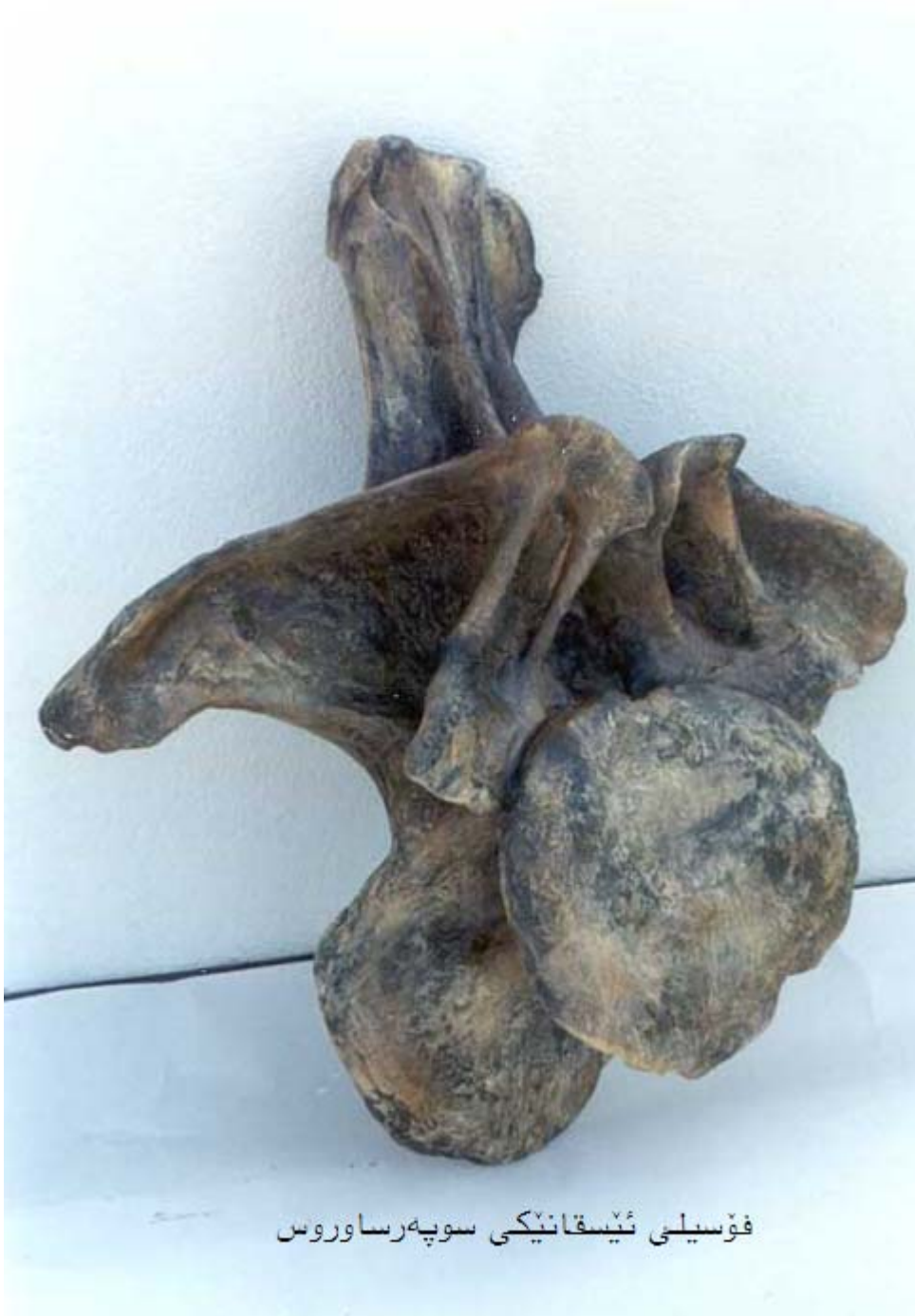
فوسيلي ئيسقانيكي سوپه رساوروس